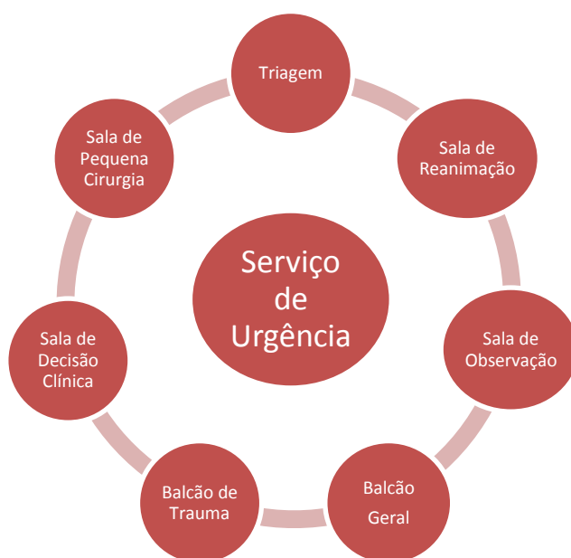
Figura 1: Constituição do Serviço de Urgência

A constituição do serviço de urgência é então a demonstrada na seguinte figura (1):