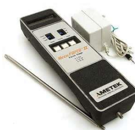
Figura 9 – Dinamómetro portátil Ametek ML4432-1 Accuforce II. Extraído de

Relativamente aos recursos materiais necessários à execução do estudo concluímos que na generalidade não é preciso tomar precauções especiais em termos de obtenção dos materiais indicados já que a grande maioria é facilmente acessível. De todos os equipamentos referidos na metodologia, apenas o dinamómetro portátil Ametek ML4432-1 Accuforce II (Figura 9) será de difícil aquisição. Após contactos realizados com a empresa Ametek apercebemo-nos que não existem distribuidoras da marca em Portugal e que o preço base do dinamómetro desejado é bastante elevado (750 dólares norte-americanos).