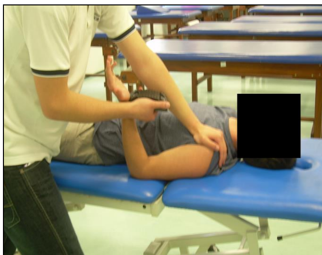
Figura 4 – Avaliação da força dos flexores do cotovelo do membro superior não dominante utilizando um dinamómetro portátil.

superior em teste deverá estar numa posição neutra (sendo estabilizado/imobilizado pelo avaliador ou por um assistente) e com o braço alinhado ao longo do tronco. O cotovelo deverá estar numa posição mantida de 90° de flexão com o antebraço disposto em supinação. Na face anterior do antebraço (logo abaixo do punho e entre as extremidades inferiores do rádio e cúbito) deverá ser posicionado o sensor do dinamómetro portátil (seguro e mantido nessa posição pelo avaliador) contra o qual o indivíduo deverá realizar uma contração dos flexores do cotovelo durante 4 a 5 segundos (Bohannon, 1997). Este processo de mensuração da força encontra-se demonstrado abaixo, na Figura 4. Este método será adoptado para avaliar a força nos 6 momentos de avaliação e também na fase inicial de selecção da amostra.