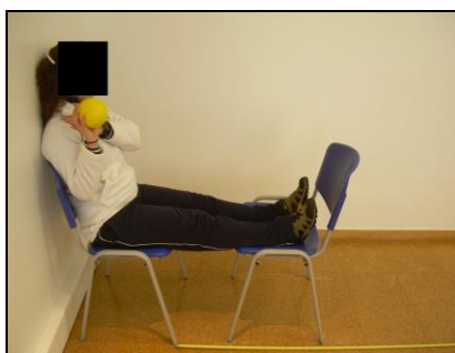
Figura 8 – Exemplo de execução do Single Arm Seated Shot Put Test (vista lateral).

Validade – Segundo vários autores (Clemons, Campbell & Jeansonne, 2010; Harris, Wattles, DeBeliso, Sevene-Adams, Berning & Adams 2011; Negrete et al., 2010), este tipo de teste funcional é um meio prático e simples de avaliar a performance funcional (sobretudo associada à potência muscular funcional) dos membros superiores. Assim sendo, apesar de não ter sido encontrada literatura que analisasse a validade deste exame como método de avaliação da performance funcional dos membros superiores, podemos concluir que existe uma certa validade de conteúdo neste teste de desempenho.