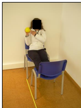
Figura 7 – Exemplo de execução do Single Arm Seated Shot Put Test .

Performance funcional do membro superior.