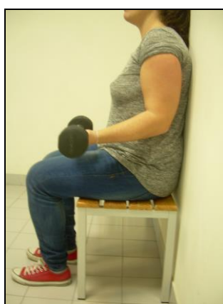
Figura 1 – Posicionamento correcto para realização do protocolo de exercícios para indução da DMR.

Os sujeitos encontrar-se-ão sentados no banco com o tronco encostado a uma parede adjacente, de modo a evitar movimentos compensatórios com o mesmo. Os ombros deverão estar numa posição neutra e uma pega em supinação será mantida durante e entre as repetições, como está exemplificado na Figura 1.