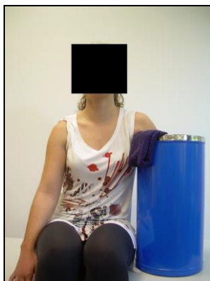
Figura 2 – Colocação do membro superior em teste num contentor cilíndrico para realização de banho de imersão em água fria.

Com o fim de se tentar diminuir o desconforto sentido e o risco associados à reduzida temperatura da água, o sujeito utilizará uma luva isotérmica e poderá mover o membro superior em teste, enquanto este se encontra no interior do contentor. Por outro lado deverá ser colocada uma toalha entre a axila e o bordo do contentor também por motivos de conforto e segurança, como demonstrado na Figura 2.