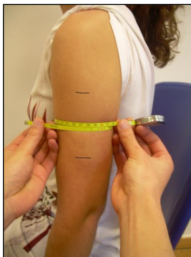
Figura 6 – Avaliação da dimensão do edema através da perimetria.

medições serão realizadas a 1/3, 1/2 e a 2/3 da distância entre os dois pontos acima enunciados. Este método de medição foi adaptado do protocolo de avaliação utilizado por Eston e Peters (1999) e encontra-se exemplificado na Figura 6.