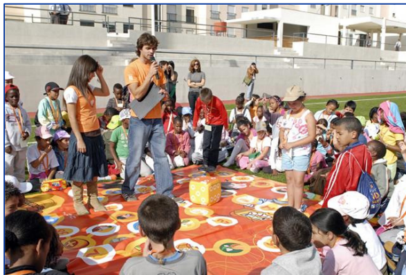
Fig. 5 - Comemorações do Dia Mundial da Alimentação – Parque Desportivo Carlos Queiroz (Carnaxide)