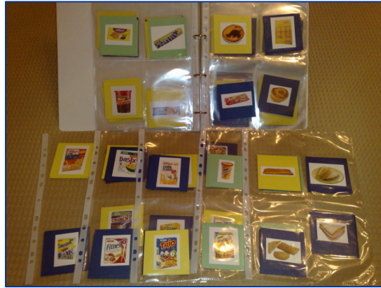
Fig. 4 - Álbum fotográfico