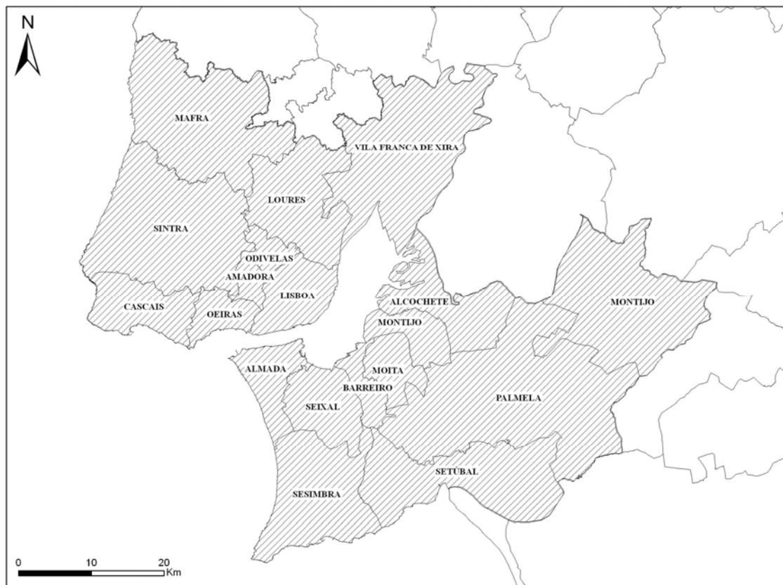
Figure 1 – Lisbon Metropolitan Area and its 18 municipalities